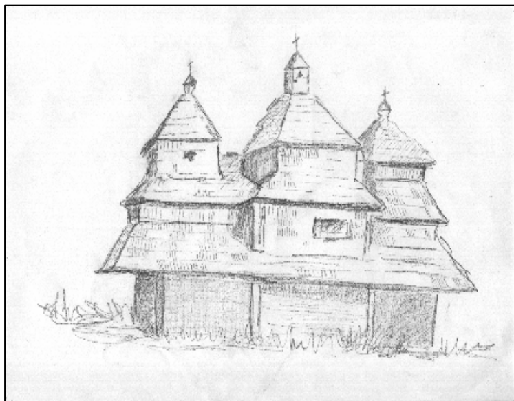
Nieistniejąca cerkiew w Chrewcie

Drewniana, parafialna p.w. św. Paraskewii, została zbudowana w roku 1670, a w roku 1899 odnowiona. Rozebrana po roku 1945. Obecnie miejsce, gdzie stała cerkiew, jest zalane wodami Zalewu Solińskiego.